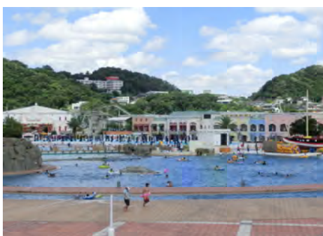
昨年のラグナシア